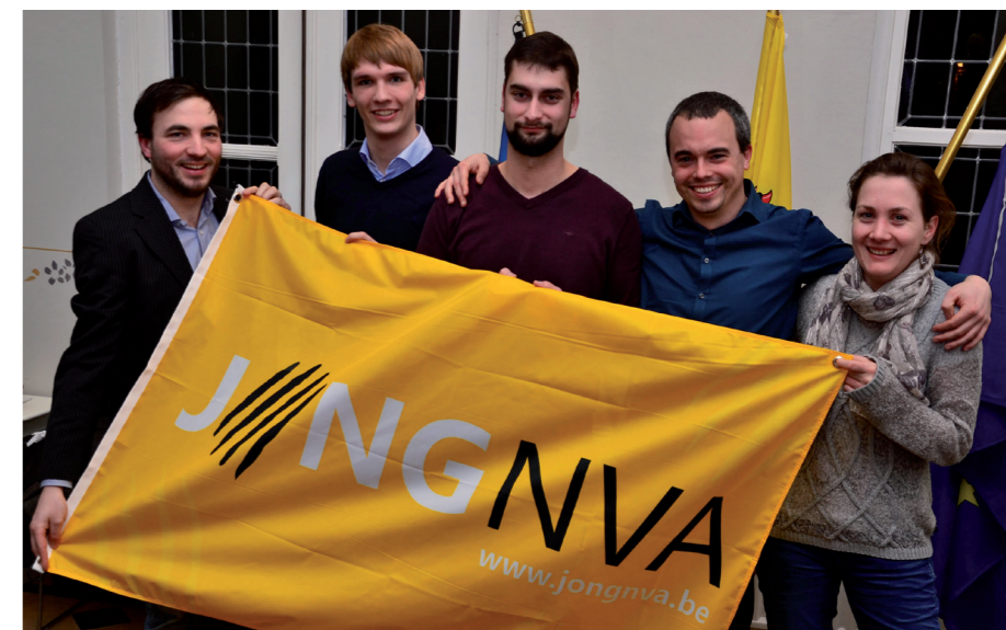
▲ De jonge kracht van ons afdelingsbestuur.