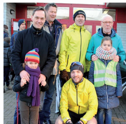
▲ Een deel van de N-VA-delegatie klaar voor de 25 km.