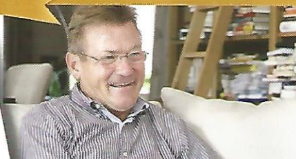
Johan Van Overtveldt