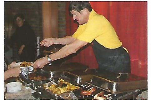
▲ Breugelavond opnieuw een succes.

Tussen alle activiteiten door wordt er ook vergaderd en geschreven aan visieteksten per beleidsthema. De eerste resultaten