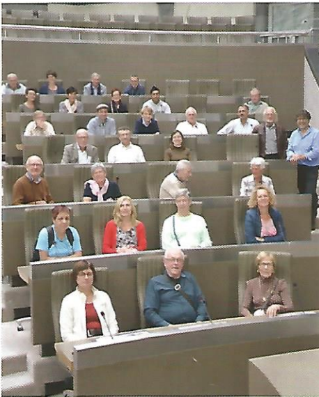
▲ N-VA Buggenhout bezoekt Vlaams Parlement.

Op zaterdag 8 oktober maakte onze afdeling een uitstap naar het hart van de democratie, onze hoofdstad. Onder leiding van deskundige gidsen genoten we van de rondleidingen in het Vlaams Parlement en in de Brusselse Marollenwijk. De uitstap werd zeer gesmaakt en plannen voor een vervolg kan je lezen in onze volgende publicaties.