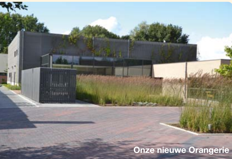
Onze nieuwe Orangerie

De nieuwe Orangerie draait stevig door! Naast een succesvolle buitenschoolse kinderopvang in een rus- tige omgeving wordt duchtig gebruik gemaakt van de grote zaal, cafetaria, opslagruimte of vergaderzaaltje. Een tiental verenigingen maakt op regelmatige basis gebruik van de hen geboden infrastructuur. Boven- dien vinden ook almaar meer sporadische activitei- ten of particulieren voor bv. de organisatie van een babyborrel de weg naar deze mooie locatie. Omdat we zeker niet in concurrentie willen treden met de be- staande horecazaken worden eetfestijnen niet toege- staan.