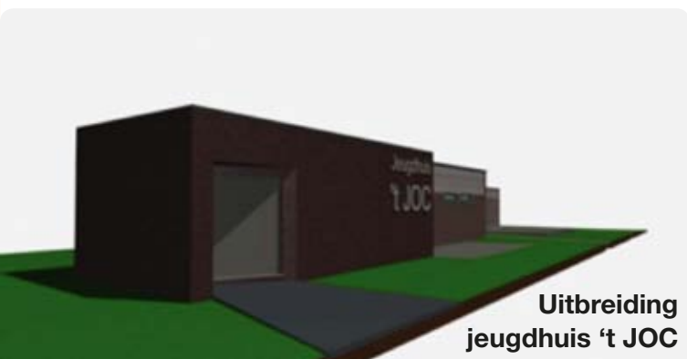
Uitbreiding jeugdhuis 't JOC

Jeugdruimte is en blijft een essentieel onderdeel van het gemeentelijk beleidsplan. De afgelopen jaren werden tientallen realisaties gesteund onder leiding van schepen van jeugd Jan Jacobs. In 2008 werd zelfs beloofd dat er een nieuw jeugdcentrum zou worden gebouwd, maar die plannen werden alsnog van tafel geveegd. N-VA geeft zich natuurlijk niet zomaar gewonnen.