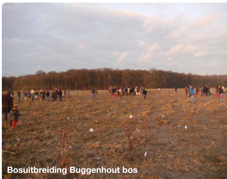
Bosuitbreiding Buggenhout bos