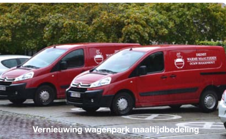
Vernieuwing wagenpark maaltijdbedeling

Bovenlokaal is een voorstel in de maak dat gemeenten verplicht om hun OCMW als integraal onderdeel te zien van het gemeentebestuur. In afwachting van die verplichting, anticipeert Buggenhout via de beleidsnota 2014-2019 alvast op een intensere samenwerking tussen de gemeentelijke en de OCMW-diensten. Zo werd intussen een letterlijke verbinding (glasvezel) gemaakt om de beide computersystemen aan elkaar te koppelen. Op die manier gaan er geen gegevens verloren bij brand of ander onheil. Er worden ook gesprekken gestart voor de analyse van een nauwe samenwerking op vlak van administratief, technisch en financieel beheer.