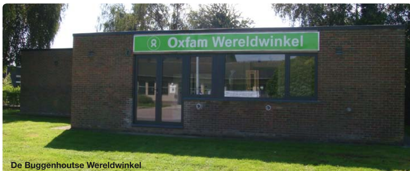
De Buggenhoutse Wereldwinkel

Openingsuren: donderdag van 09.00u. tot 13.00u. zaterdag van 09.00u. tot 17u.00u.