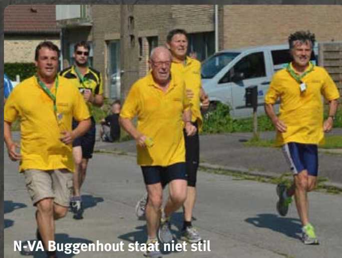
N-VA Buggenhout staat niet stil