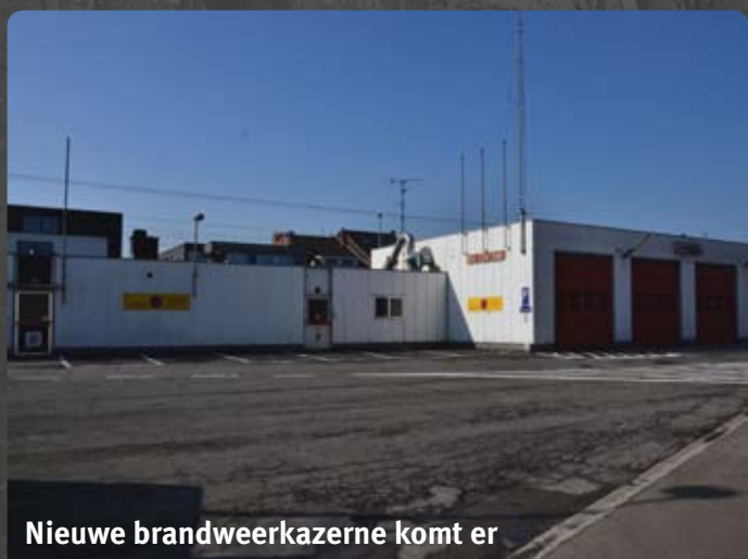
Nieuwe brandweerkazerne komt er