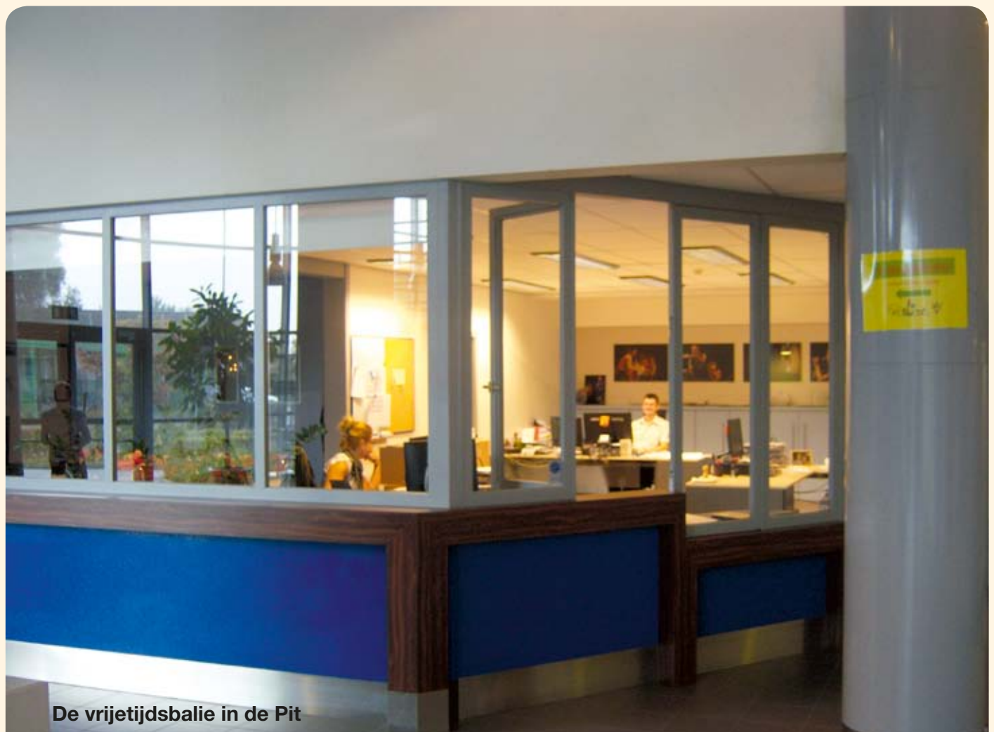
De vrijetijdsbalie in de Pit