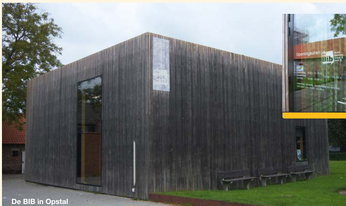
De BIB in Opstal