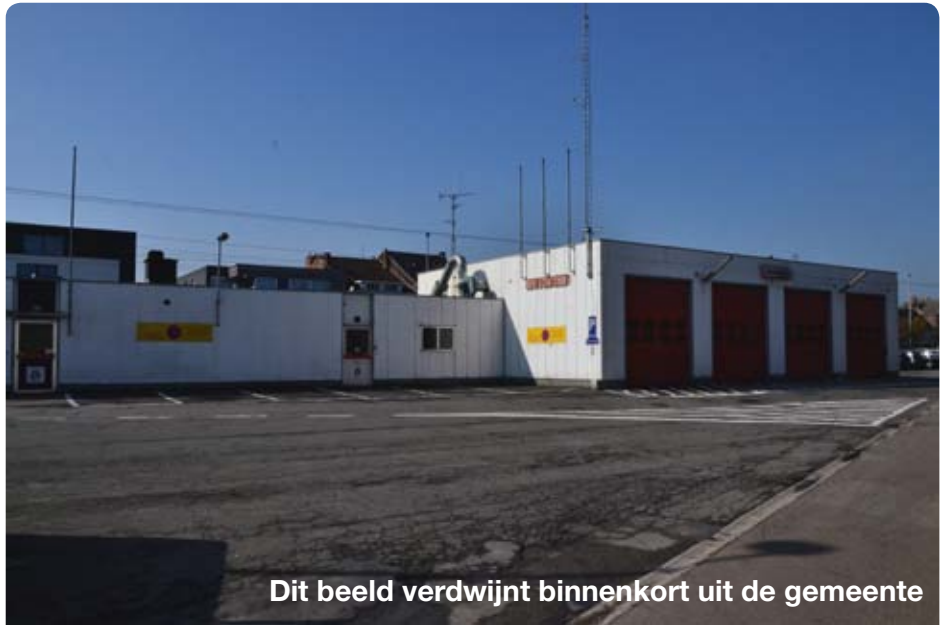
Dit beeld verdwijnt binnenkort uit de gemeente