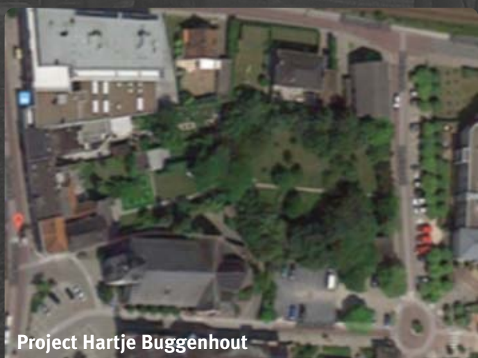
Project Hartje Buggenhout