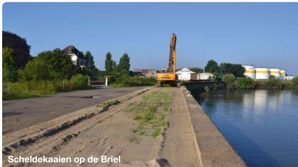
Scheldekaaien op de Briel

De stad Dendermonde heeft samen met het provinciebestuur en de dienst waterwegen en zeekanaal, hebben haar oog laten vallen op den ouden Briel om aldaar "watergebonden" industrie uit de grond te stampen.