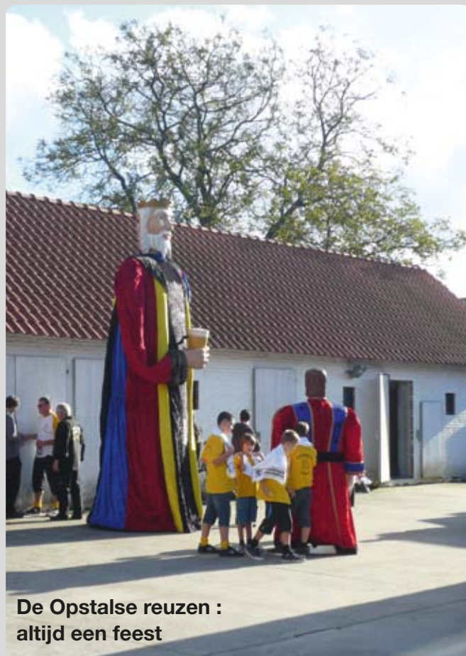
De Opstalse reuzen : altijd een feest

Buggenhout heeft een vaste traditie van levendige kermissen in elke deelgemeente. N-VA wil deze evenementen blijven ondersteunen, maar wel op een verantwoorde manier. Dit betekent enerzijds dat het budget voor feestelijkheden scherp in de gaten gehouden wordt. Anderzijds vinden wij niet dat de gemeente hierover alles moet bepalen. Beter is het om de ideeën en de uitwerking van de jaarmarkt en kermissen van de bewoners en verenigingen te laten komen. Dit lukt alvast heel aardig in Opstal en Opdorp.