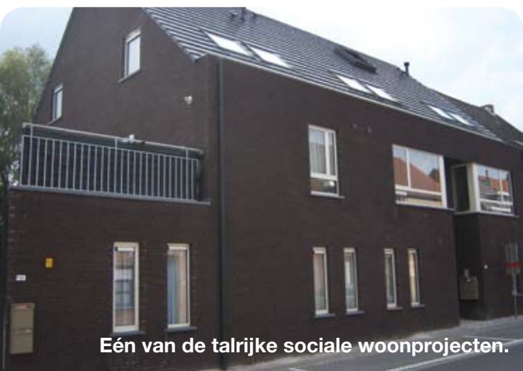
Eén van de talrijke sociale woonprojecten.

Er is grote nood aan een degelijk sociaal woonaanbod. De door de Vlaamse overheid verplichte doelstellingen : 106 huur-, 45 koopwoningen en 21 sociale koopkavels zitten in de planning voor deze legislatuur. Dit aanbod komt in eerste instantie onze eigen inwoners ten goede en bestaat uit een mix van grote en kleinere projecten over het ganse grondgebied. Schepen Jacobs zette jaren geleden de eerste sociale woonprojecten op de sporen.