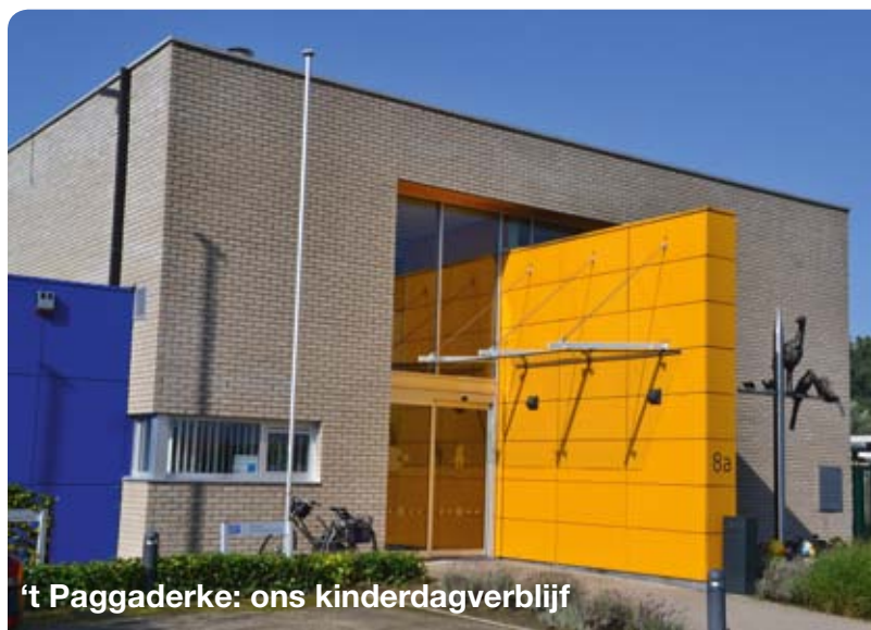
't Paggaderke: ons kinderdagverblijf

Het kinderdagverblijf 't Paggaderke is een dienstverlening die het OCMW aanbiedt. Deze staat onder toezicht van Kind en gezin en biedt opvang aan 36 kindjes van 0 tot 3 jaar. Men werkt er met drie leeftijdsgroepen: baby's, lopers en peuters. Het huidige beleidsklimaat zorgt ervoor dat er wordt gestreefd naar een efficiënte werking. De werking van het kinderdagverblijf werd door een externe firma onder de loep genomen en deze heeft verschillende suggesties geformuleerd om de werking te optimaliseren, meer bepaald op financieel vlak. Dit heeft geleid tot enkele moeilijke beslissingen. Desondanks blijft het personeel uitstekend werk leveren, waarvoor hartelijk dank.